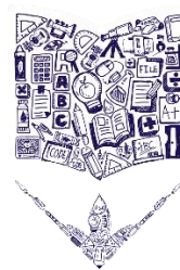
SCUOLA SECONDARIA DI I° GRADO