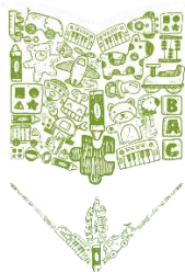
SCUOLA INFANZIA Sezione Primavera